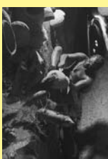
NAIXEMENT Riu Françolí A P F